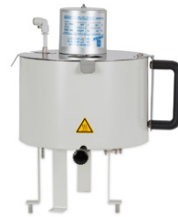
Spray Chilling 시료 가열 및 냉각컬럼에 분무