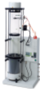
Nano Spray Dryer B-90 미량 시료와 미세 입자를 위한 나노분무건조기