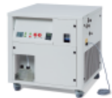
Inert Loop B-296 유기용매의 분무건조