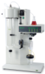
Mini Spray Dryer B-280 세계적인 소형분무건조기