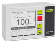
Interface I-100 Экономичное регулирование вакуума