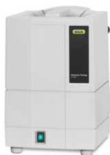
Vacuum Pump V-100 Экономичный источник вакуума