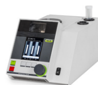
Melting Point M-560 / M-565 Определение точки плавления