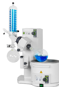
Rotavapor® R-215 Превосходство в испарении