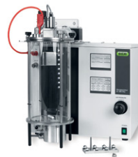
Encapsulator B-395 Pro

Secador por atomização para pequenas amostras e partículas