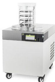
Lyovapor™ L-300 Первый прибор для непрерывной лиофильной сушки в лаборатории