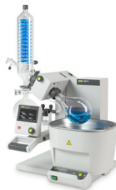
Rotavapor® R-300 Удобное и эффек- тивное ротацион- ное управление