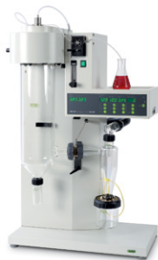
Mini Spray Dryer B-290 Лучшая в мире лабо- раторная распыли- тельная сушилка