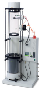
Nano Spray Dryer B-90 미량 시료와 미세 입자를 위한 나노분무건조기