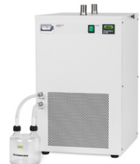
Dehumidifier B-296 분무건조를 위한 재현가능 제습