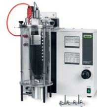
Encapsulator B-395 Pro 일관된 멸균 비드 및 캡슐 생산